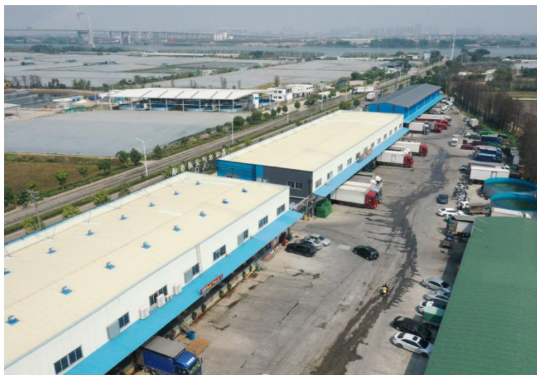
品丰水产交易中心